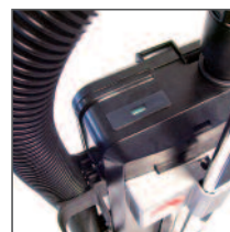
Segnalatore sacco pieno.