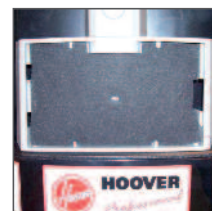
Microfiltro di serie classe M