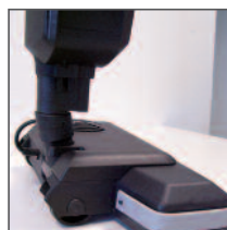
Accessorio battitappeto optional, snodato