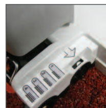
Selettore per regolazione altezza rullo